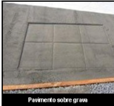
Pavimento sobre grava