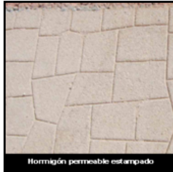
Hormigón permeable estampado