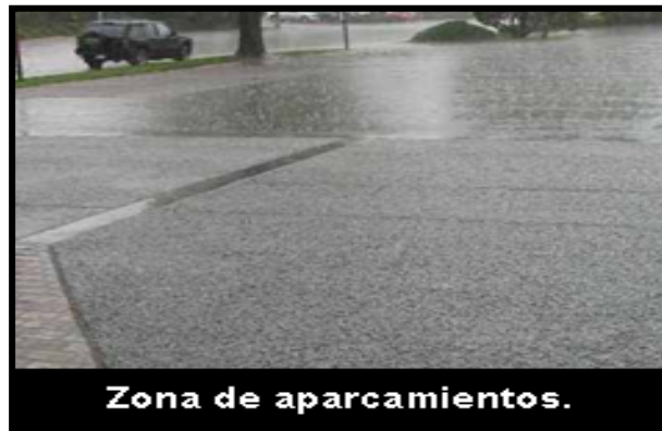
Zona de aparcamientos.

Suministro y puesta en obra de piso del sistema e.PAVIPOR (8CMS), realizado en obra con acabado pulido o floteado o nivelado, armado con malla electrosoldada, incorporando en la masa un aditivo especial con revenimiento cero, a razón de 13 LTS/M3, fibras de polipropileno “anticrak”, superficie de alta resistencia al tráfico (sin incluir en esta partida su acabado que puede ser pavimento sintético, resina epoxi o poliuretano), incluye materiales, mano de obra, vertido y extendido, colocado y curado incluso cortes con máquina grooving roller.